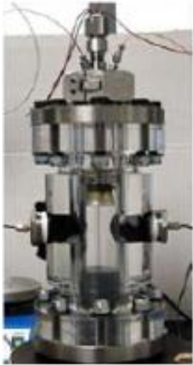
Sonoréacteur conçu en collaboration avec la société Dynaflo. Pression de service=15 MPA (V=0.6l)

Il s'agit d'un ensemble de dispositifs expérimentaux permettant d'étudier les propriétés de transports des fluides et leur comportement en milieu confiné, de caractériser les milieux poreux ainsi que de mesurer et caractériser mécaniquement les matériaux.