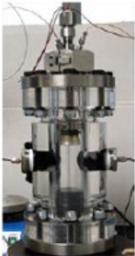
Sonoreacteur conçu en collaboration avec la société Dynaflo. Pression de service=15 MPA (V=0.6l)

Il s'agit d'un ensemble de dispositifs expérimentaux permettant d'étudier les propriétés de transports des fluides et leur comportement en milieu confiné, de caractériser les milieux poreux ainsi que de mesurer et caractériser mécaniquement les matériaux.